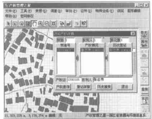
图 3 土地产权产籍管理系统运行实例

根据本文提出的空间数据模型和方法, 研制开发了一套基于 SQL Server 7.0 数据库平台的精简型空间数据库引擎 Spatial Database Guide (SDG) 软件产品, 实现了在 SQL Server 关系型数据库中对空间图形数据进行存储、拓扑运算和拓扑分析等操作。在商业化的三级客户/服务器结构的土地产权产籍管理系统中得到应用。图 3 为 SDG 在土地产权产籍管理系统运行的实例。系统对地理实体和数据库连接分别进行封装, 地籍图形数据通过空间数据库引擎 SDG 存入 SQL Server 数据库中, 系统实现了对土地产权产籍管理工作全过程的动态管理。对宗地的变更历史可以进行快速浏览, 对于已成为历史状态进入历史库的数据, 也可方便地进行图形属性双向互查。系统可以按变更的历史顺序依次撤消, 将最后一次认可的历史数据回退到现时库中(时空数据模型是该研究的另一重点, 这里不进一步展开)。此外, 系统还提供了图形编辑、输出、数据自动备份、系统修复、互联网信息查询、系统维护及安全保护等功能。在土地产权产籍系统中的应用表明, 空间数据库引擎 SDG 运行稳定, 性能良好, 易于开发, 适用面广。在本室承担的水利等其他 GIS 应用领域也得到了很好的应用, 替代了昂贵的进口同类产品。但 SDG 仅是一个精简型的空间数据库引擎, 总体功能还有待于进一步完善, 目前正在进行这方面的研究开发和改进工作。