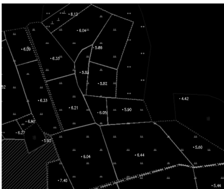
图 4 RTK 地籍数据图 Fig. 4 RTK cadastral map

介绍了 GPS RTK 技术在数据采集方面的应用方法,最后结合具体的地籍测量应用实例,进行分析,并得出以下结论: