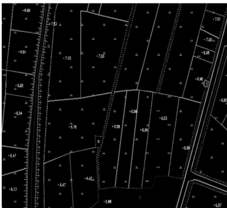
图 3 RTK 地籍数据图 Fig. 3 RTK cadastral map