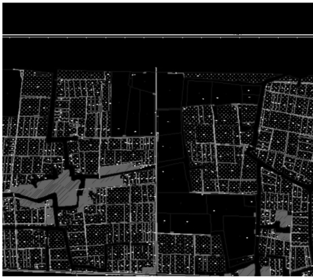
图 2 RTK 地籍数据图 Fig. 2 RTK cadastral map