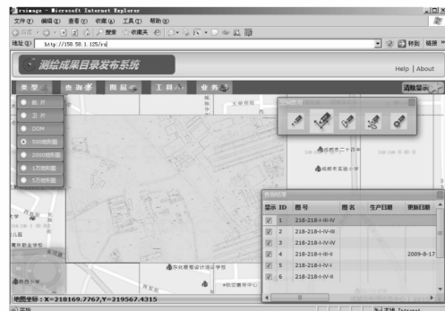
图 4 地形图浏览界面

分幅栅格地形图发布成功后, 即可在测绘成果查询系统中实现 1: 500 栅格地形图的单幅、多幅、指定范围等方式的快速浏览, 也可实现根据分幅号、图名等属性进行快速查询和浏览, 浏览时由于只调用当前窗口的栅格地形图, 因此极大地提高了浏览速度, 实现了数据的有效共享(如图 4 所示)。