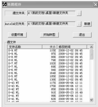
图 2 批量转换 DWG 程序界面

MapGIS 格式 1: 500 地形图数据的分幅和转换是借助在 MapGIS 下开发了批量转换 DWG 程序来实现的。首先在 MapGIS 中将 1: 500 地形图进行分幅建库, 生成单幅的按图幅号命名的 MapGIS 格式地形图, 再利用批量转换 DWG 程序得到按图幅号命名的单幅 DWG 文件(如图 2 所示)。