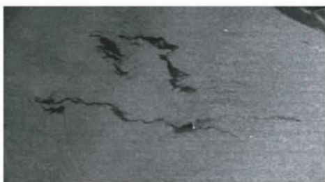
图3 2011年6月21日渤海 ENVISAT 图像

2011年6月渤海蓬莱19-3平台发生溢油, 国家卫星海洋应用中心使用ENVISAT ASAR卫星数据(Wide模式, 150m分辨率, VV极化)对其进行了跟踪监测。图3为ENVISAT ASAR图像快视图。