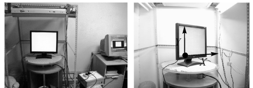
图 2 实验设备

实验设备是一个用于工件摄影测量的旋转平台(如图 2),根据 LCD 平面的法线方向与摄像机主光轴方向的夹角定义 \theta 角,使用平台每旋转 10^\circ 拍摄生成实验数据。考虑到数据质量,仅选择 0^\circ \sim 70^\circ 的影像做实验。使用 Nikon COOLPIX P5100 相机获取数据,焦距 7.5 mm,像幅为 4\ 000 \times 3\ 000 像素。